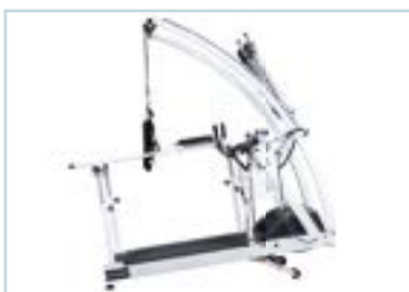
Sicherheitsbügel mit Fallstopp inklusive Brustgeschirr