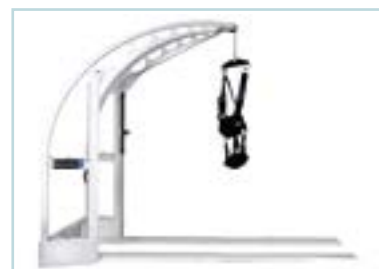
System zur Gewichtsentlastung