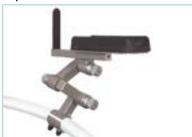
Armstützen verstellbar in Höhe und Breite