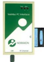
PC INTERFACE RECEIVER

Standard Receiver mit USB Verbindung zum PC