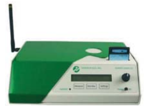
ANALOG OUTPUT RECEIVER

Mit 8 zusätzlichen Input-Kanälen & Wireless-Sync-System