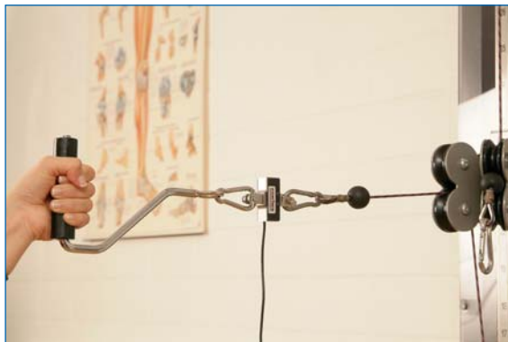
Der Sensor kann in die meisten Kabelzugmaschinen integriert werden.

Der Sensor kann mit jeder kommerziellen Kabelzugmaschine verbunden werden. Dieses Arrangement erlaubt die Gestaltung einer Vielzahl von Testpositionen, um statische Kraft funktional zu messen. Derartige Setups können genutzt werden, um Therapie- sowie Trainingsfortschritte zu dokumentieren.